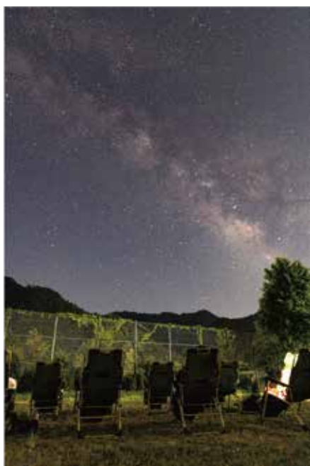
【上北山村の満天の星空の下で伝えたい宇宙】

【その他お問い合わせ先】 上北山村役場企画政策課 住所 上北山村河合330 TEL 07468-2-0002