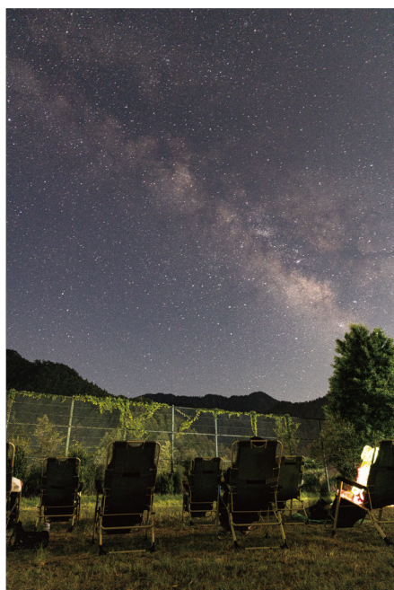
【上北山村の満天の星空の下で伝えたい宇宙】

【その他お問い合わせ先】 上北山村役場企画政策課 住所 上北山村河合330 TEL 07468-2-0002