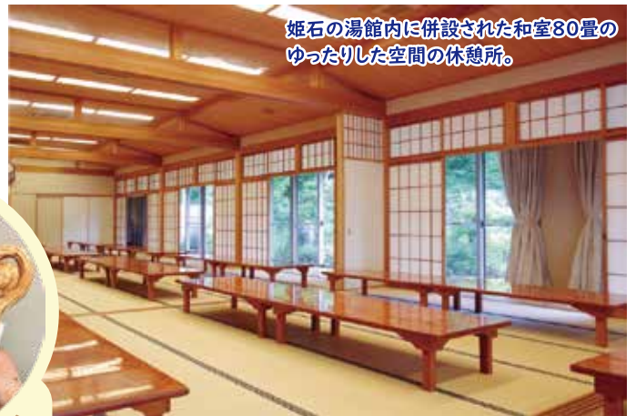
姫石の湯館内に併設された和室80畳のゆったりした空間の休憩所。