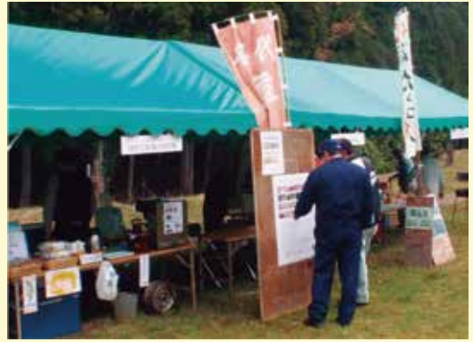
会場の臨時駐車場は半夏生園から徒歩で約10分の場所♪

【日時】令和7年7月12日(土)・13日(日) 午前10時～午後3時 ※雨天中止 【場所】半夏生園 臨時駐車場 【出店内容】(昨年度例:お漬物・草餅・珈琲・洋菓子など)