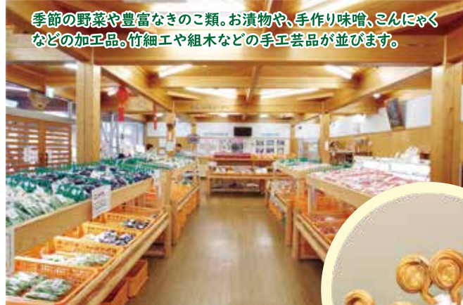
季節の野菜や豊富なきのこ類。お漬物や、手作り味噌、こんにやくなどの加工品。竹細工や組木などの手工芸品が並びます。